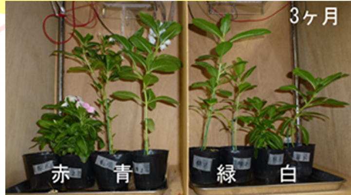
赤・青・緑・白色のLEDで育てた ニチニチソウ

日時 令和3年11月23日(火) 令和3年12月12日(日) 午後1時から午後4時 場所 徳島大学歯学部 対象 小学4年生～6年生(各12名)