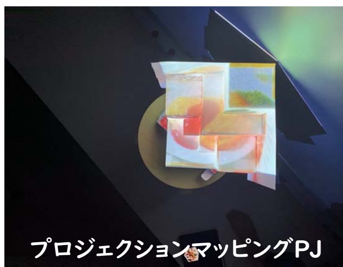
プロジェクションマッピングPJ